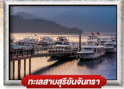
ทะเลสาบสุริยอันจินตรา

พิเศษ!! เสี่ยวหลงเปา + ซิฟู้ดสไตล์ไต้หวัน