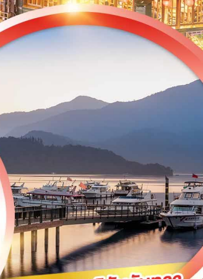
ทะเลสาบสุริยันจันทรา