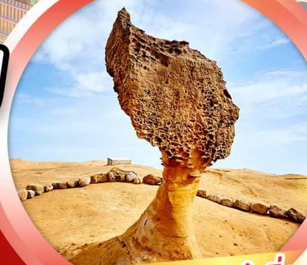
อุทยานแห่งชาติหลิว