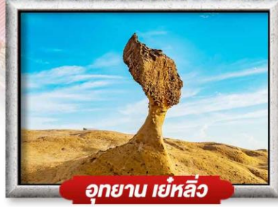
อุทยาน เย่หลิว