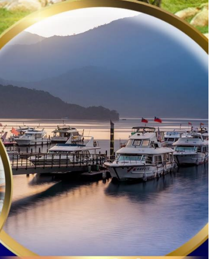
ทะเลสาบ สุริยันจันทรา