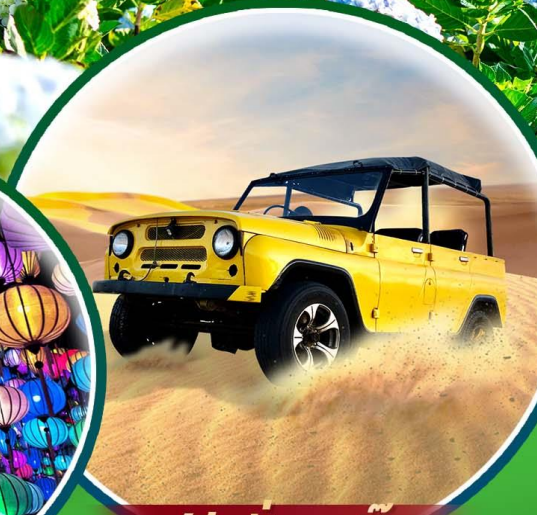
ฟรี! นั่งรถจี๊ป

พักดี 4 ดาว ที่เมืองดาลัด น้ำตกดาตันลา กุ้งโฮเดรนเยีย นั่ง cable car ชมวัดตักลิ้ม ล่ำธารนางฟ้า โบสถ์นอร์ทเธอดาม