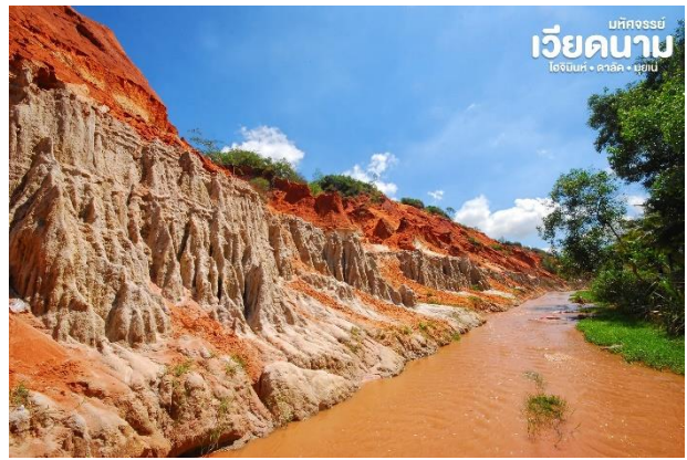
มัทศจรรย์ เวียดนาม โฮจิมินห์ • ดาลัด • มุยเน่

เช้า ๑๑ บริการอาหารเช้า ณ ห้องอาหารโรงแรม พาชม ลำธารนางฟ้า Fairy Stream ลำธารน้ำ สายเล็กๆที่ไหลลัดเลาะผ่านโตรกหน้าผาไปยัง ทะเล ดินในบริเวณลำธารที่น้ำไหลผ่านไปมี ลักษณะเนื้อละเอียดเป็นดินสีแดงอมส้ม ตัดกับ เมฆขาว