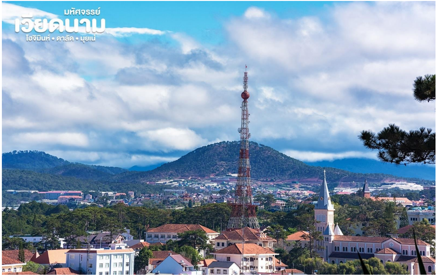
มัทศจรรย์ เวียดนาม โฮจิมินห์ • ดาลัด • มุยเน่