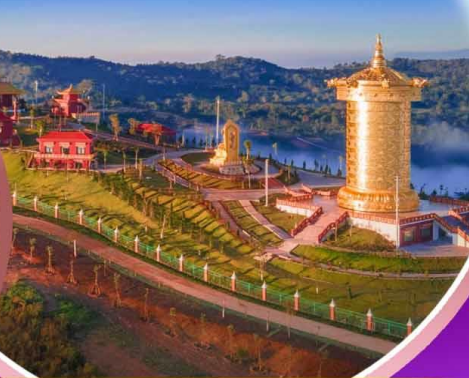
Samten Hills Dalat