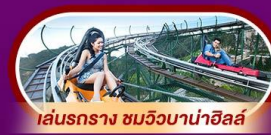
เล่นรอกาง ชมวิวบานาฮิลล์