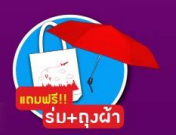
แถมฟรี!! ร่ม+ถุงผ้า