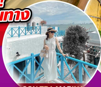
SON TRA MARINA