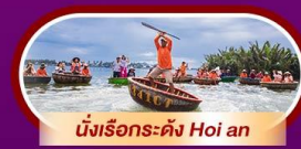
นั่งเรือกระดิง Hoi an