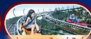
เล่นรถไฟเหาะ บานาฮิลล์