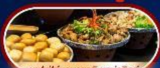
บุฟเฟ่ต์นานาชาติ บานาฮิลล์