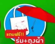
แถมฟรี! ร่ม+ถุงผ้า