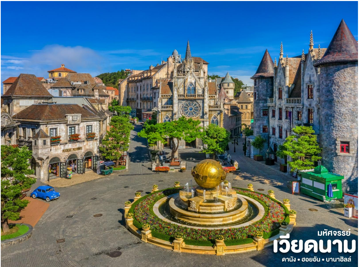
มัทศจรรย์ เวียดนาม คาบัง • ออยอัน • บานาฮิลล์

และบางจุดมีเมฆลอยต่ำกว่ากระเช้าพร้อมอากาศบริสุทธิ์อันสดชื่นจนทำให้ท่านอาจลืมไปเสียด้วย ซ้ำว่าที่นี่ไม่ใช่ยุโรปเพราะอากาศที่หนาวเย็นเฉลี่ยตลอดทั้งปีประมาณ 10 องศาเท่านั้น