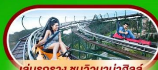
เล่นรถราง ชมวิวบานาฮิลล์

นั่งกระเช้าที่ยาวที่สุดในโลก ขึ้นสู่บานาฮิลล์ ฮอยอัน เมืองมรดกโลกที่สวยงามและเจียบสงบ