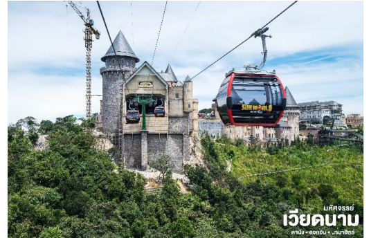
มัทศจรรย์ เวียดนาม คาบัง - ออยอัน - บานาฮิลล์

นั่งกระเช้าขึ้นสู่บานาฮิลล์ กระเช้าแห่งบานาฮิลล์นี้ ได้รับการบันทึกสถิติโลกโดย World Record ว่าเป็น กระเช้าไฟฟ้าที่ยาวที่สุด ประเภท Non Stop โดยไม่หยุด แะมีความยาวทั้งสิ้น 5,042 เมตร และเป็นกระเช้าที่สูง ที่สุด 1,294 เมตร นักท่องเที่ยวจะได้สัมผัสปุยมะหมอก