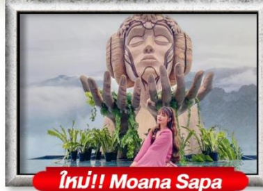
ใหม่!! Moana Sapa