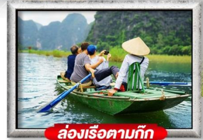
ล่องเรือตามกัก