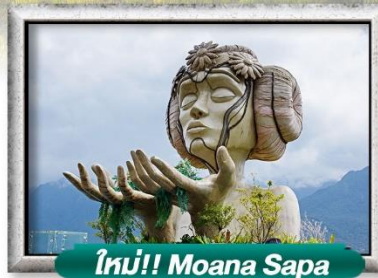
ใหม่!! Moana Sapa