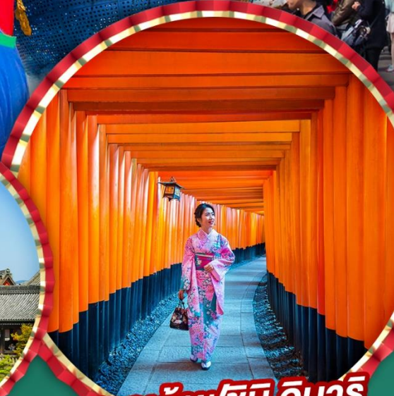
ศาลเจ้าฟุชิมิ อินาริ