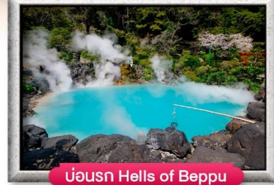
บ่อน Onsen Hells of Beppu

พิเศษ! บุฟเฟ่ต์ปิ้งย่างยากินิคู, บุฟเฟ่ต์ชาบู