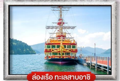
ล่องเรือ ทะเลสาบอาชิ