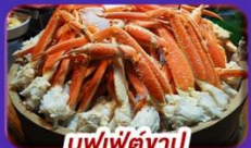
ปูเฟ็ดจ๊าปู