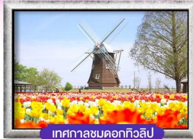
เทศกาลชมดอกทิวลิป