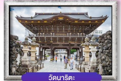
วัดนาริตะ