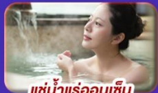
แช่น้ำแร่ร้อนเซ็น