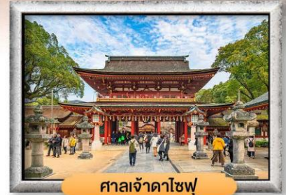
ศาลเจ้าดาโซฟุ