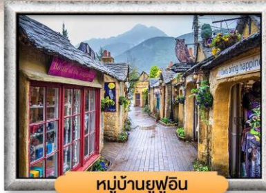
หมู่บ้านยูฟูอิน