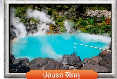
บ่อนรก จิโกกุ