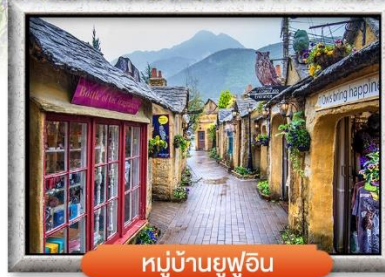
หมู่บ้านยูฟูอิน