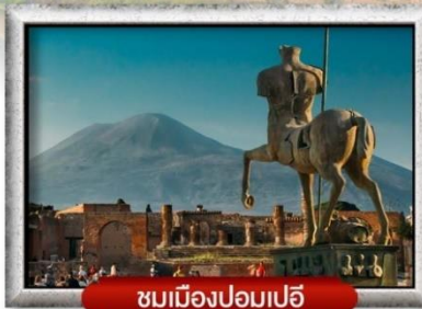
ชมเมืองปอมเปอี