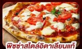
พิซซ่าสโตรอิตาเลียนแท้