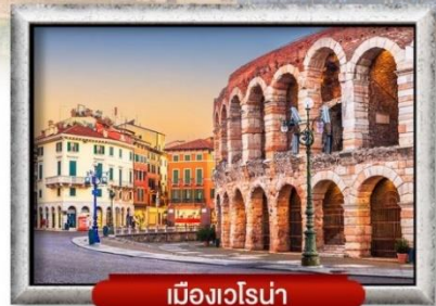
เมืองเวโรน่า

เมนู พิเศษ! สปาเกตตีเส้นหมึกดำ, พิชซ่าสไตล์อิตาลีแบบแท้