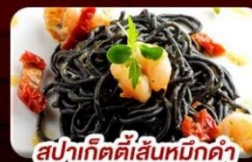
สปาเก็ตตี้เส้นหมึกดำ