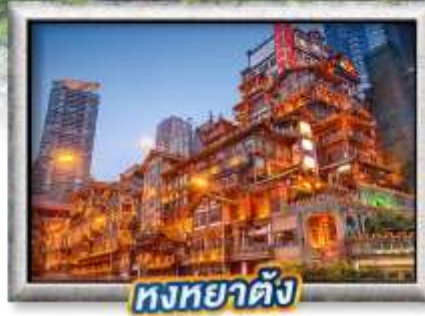
หงหย้าตั้ง