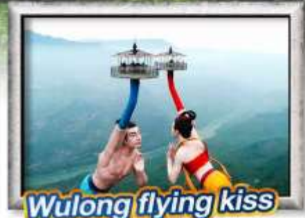
Wulong flying kiss

เมนูพิเศษ! สุกี้หมาล่าองซิ่ง, เปิดปิ้งกั๊ง