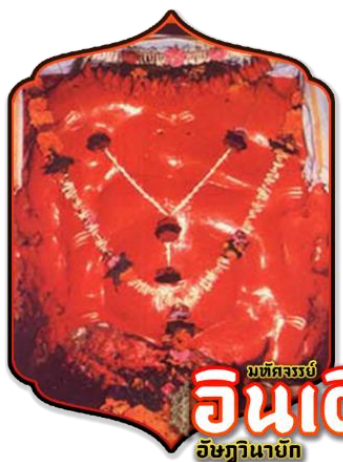
มัทฉะรมย์ อินเดียม อิชฎิยานายก

นำท่านเดินทางสักการะแห่งที่ 7 วัดศรีคีรีจัตมา (Sri Girijatmaj) ประดิษฐานอยู่ที่ เลนยาตริ ตั้งอยู่ในถ้ำบนภูเขาริมแม่น้ำกุคตี เมืองเลนยาตริ (Lenyadri) ซึ่งครั้งหนึ่งถ้ำที่ภูเขาแห่งนี้ ได้ขุด เจาะเพื่อเป็นวัดในพระพุทธศาสนา หลังจากพระพุทธศาสนาเริ่มเสื่อม ศาสนาฮินดูก็รุ่งเรือง และ ภายในถ้ำแห่งนี้ก็เกิดปาฏิหาริย์ มีพระพิฆเนศเกิดขึ้นมาทำให้ชาวฮินดูขึ้นมาแยกราชอาณาจักร จึงทำ ให้ถ้ำแห่งนี้กลายเป็นถ้ำของพระพิฆเนศ การสักการะองค์พระพิฆเนศ จะต้องขึ้นบันได 283 ขั้น เท ะต่านานแห่งนี้เล่าว่า พระแม่ปารวตี (พระอูมาเทวี) ต้องการโอรสมากจึงได้ทำพิธีปณียากพรต