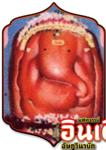
มัทฉะรมย์ อินเดียม อิชฎิยานายก

เชื่อว่าผู้มาสักการะองค์ศรีวิฆเนศวรก่อนทำการใดๆ จะทำการนั้นได้สำเร็จราบรื่น ไร้อุปสรรค