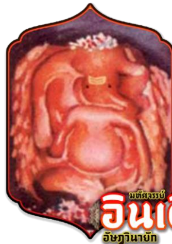
มัทฉะรมย์ อินเดียม อิชฎิยานายก

นำท่านเดินทางสู่เมืองเลนยาตริ (ใช้ระยะเวลาประมาณ 2 ชม.)