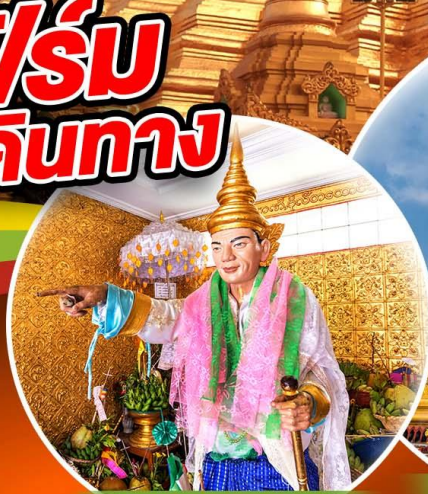
สักการะเทพทันใจ