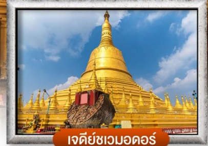
เจดีย์ชเวมอดอร์

เมนู สุดพิเศษ | กุ้งแม่น้ำเผา + บุฟเฟ่ต์นานาชาติ