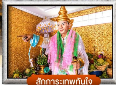
สักการะเทพทันใจ