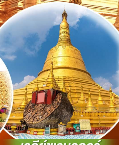
เจดีย์ชเวมอดอร์

เมียนมาร์ มหัศจรรย์ ย่างกุ้ง • หงสาวดี • ใจโท