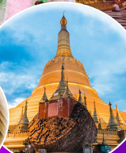
พระธาตุมูเตตา