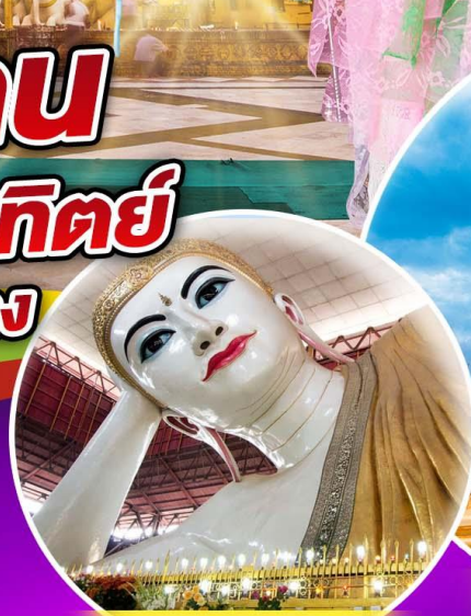
พระนอนตาหวาน