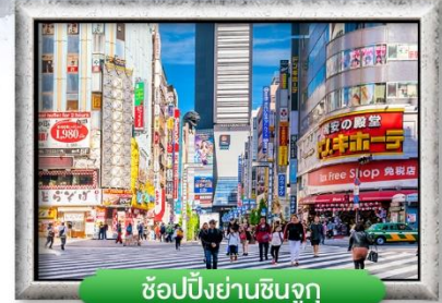
ช้อปปิ้งย่านชินจูกุ

พิเศษ! บุฟเฟ่ต์ปิ้งย่างยากินิกุ, สุกียากี้ สไตล์ญี่ปุ่น