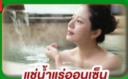
แช่น้ำแร่ร้อนชิน