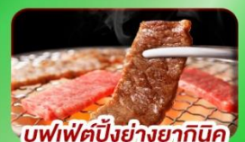
บุฟเฟ่ต์บั้งย่างยากินิกุ