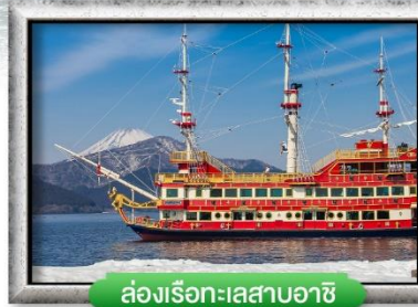
ล่องเรือทะเลสาบอาชิ