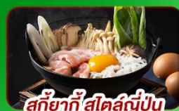
สุกี้ยากี้ สโกลด์ญี่ปุ่น